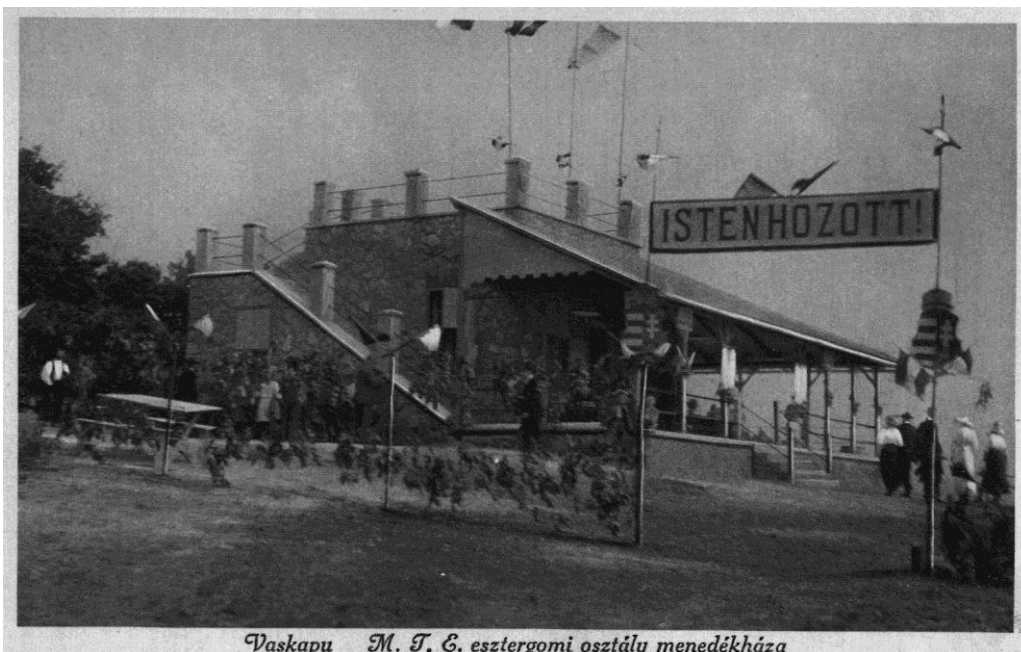
Vaskapu M. T. G. esztergomi osztály menedékháza